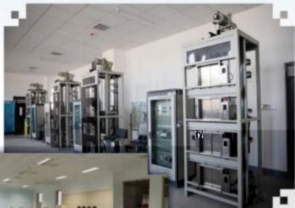
智能电梯安装调试维护训练场所