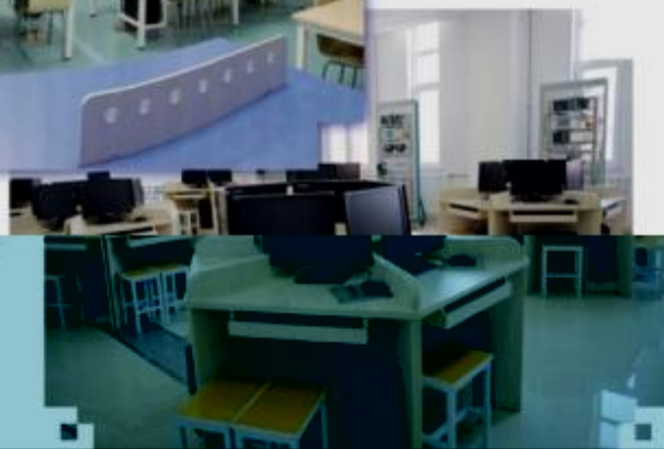
一体化课程教学设计综合实训室